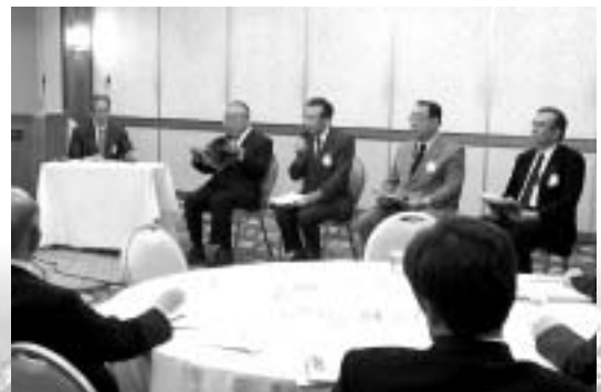
5月12日東京で開催されたロータリーの友委員会 (現・次期地区委員オリエンテーション)

8月には、新たに一般向け広報誌「Rotary Japan」が発刊されます。会員拡大などに有効利用をお願いいたします。