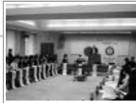
ローターアクト会長幹事会議

名鉄トヤマホテルにて世界社会奉仕委員会が開催。ポリオ撲滅への積極的な協力を確認。環境貢献、識字率向上への具体的な方法を話し合った。6名出席。