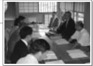
国際青少年交換委員会