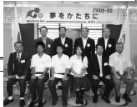
伏木高校IACがスポンサークラブ高岡RCの例会訪問

又、大人も若者達から童心を呼び起こしてもらえます。現在RC自身も苦しい状況に置かれていることは事実であります。ですから尚一層将来有望な人材を育て、RCを盛り上げてくれることを期待しながら、IACへの御協力並びに新設への御努力を切にお願いする次第です。