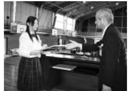
ガバナーより認証状伝達

インターアクトクラブの目標の第一は指導力の養成、自己の完成にあります。ともすれば昨今の若者に欠