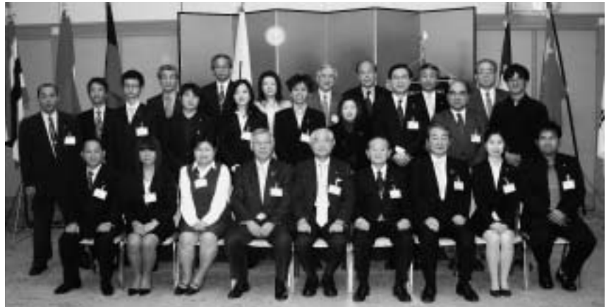
米山奨学生終了者歓送会